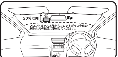
ドライブレコーダーの取付位置について

●フロントガラスの取り付けは道路運送車両法に基づく保安基準により設置場所が限定されています。フロントガラス上部より20%以内になるよう設置してください。※道路運送車両法の保安基準第21条(運転席者)細目告示第27条及び別添29●ドライブレコーダー本体が運転者の視界の妨げにならないように取り付けを行ってください。その際ルームミラーと干渉しない位置に取り付けてください。●本製品を車検シールの上に貼らないでください。●地デジやETC等のアンテナ近くには設置しないでください。●本製品近くにGPS機能を持つ製品やVICS受信機を設置しないでください。誤作動を起こす可能性があります。●フロントガラスに反射熱ガラスやメタリックフィルム等を装着している場合はGPSを測位できない場合があります。●ワイパーの可動範囲に取り付けることをお勧めします。範囲外に取り付けるとフロントガラスの汚れ、雨天時の水滴などにより記録した画像が見つからないことがあります。●衝突被害軽減ブレーキシステムのカメラや防眩ミラーのセンサー等がルームミラー裏側にある場合、車両取扱説明書に記載の禁止エリアを避けて取り付けてください。