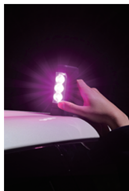
マグネットで車両に簡単設置可能