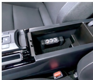
コンソールボックス