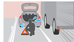
車外で三角表示板を組み立て