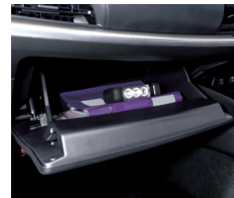
グローブボックス