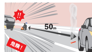
車両の50m後方へ三角表示板を設置