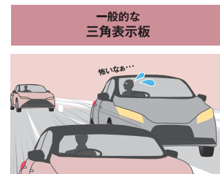
一般的な 三角表示板