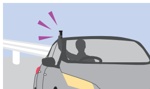
車内からパープルセーバーを設置